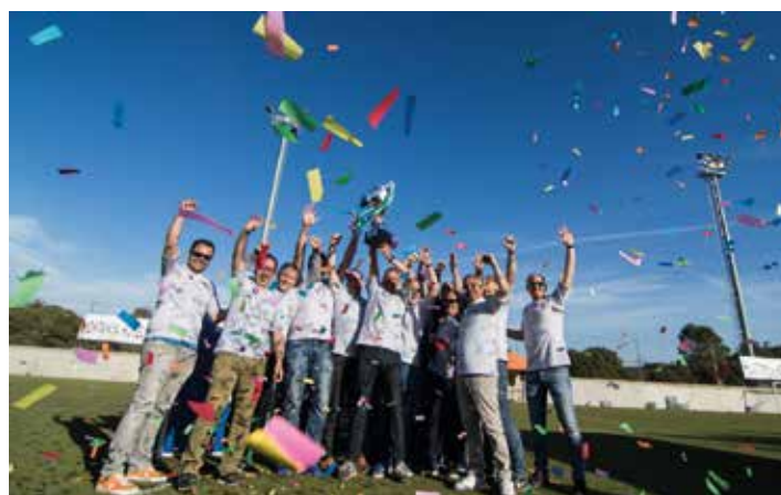
Players Sport Teambuilding