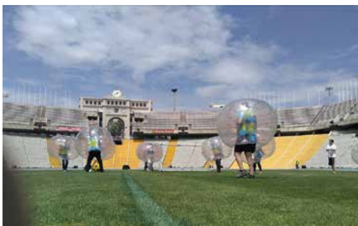
Players Sport Teambuilding

¿Quieres que tu equipo mejore su rendimiento y recargue energía para enfrentarse a los nuevos retos? Estamos pasando por tiempos difíciles y vivimos una situación inédita en la que estamos muy conectados virtualmente, pero más desconectados a nivel personal, social y laboral. En un momento en el que los equipos necesitan reconectar, motivarse, compartir, y en el que la salud es una prioridad, ¿qué mejor forma de hacerlo que practicando un deporte juntos? No todos serán grandes atletas, pero seguro que a todos les gustaría estar en formar y disfrutar de la naturaleza. El sport MICE y el active MICE son dos conceptos que empiezan a tomar fuerza, no solo aplicado a las actividades, sino también a los espacios. Desde sesiones motivacionales con deportistas de élite hasta hacer el evento en instalaciones deportivas habilitadas para acoger reuniones. Incluso, compartir una jornada con un deportista reconocido, con experiencia y conocimiento sobre las virtudes del deporte aplicadas al trabajo y a la vida.