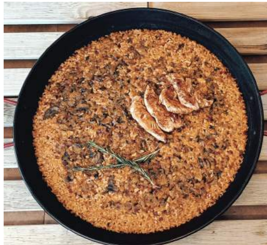
VERDURAS DE TEMPORADA Y SOLOMILLO DE POLLO