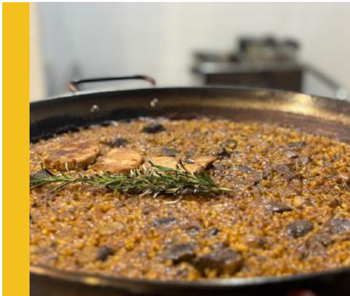
SECRETO Y RABO DE TORO