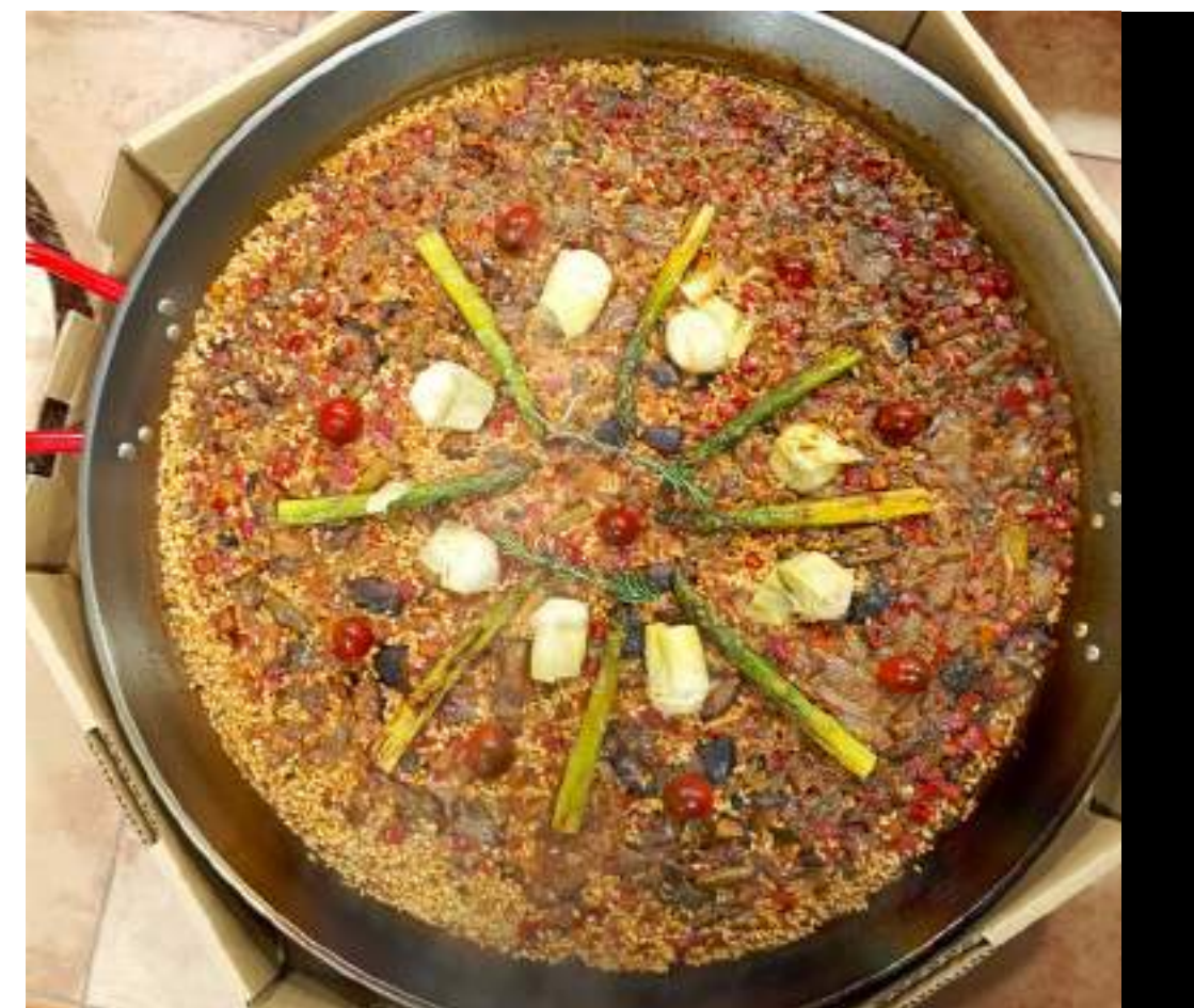
VERDURAS DE TEMPORADA