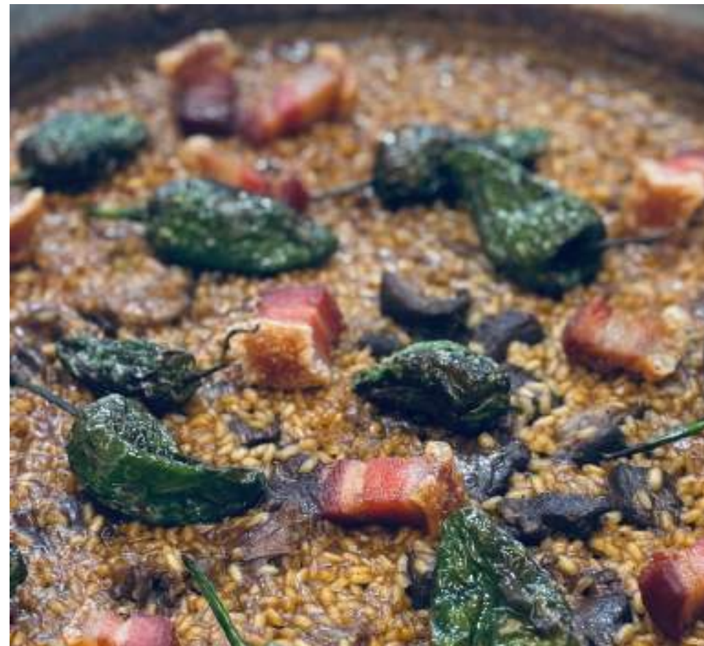
TORREZNOS Y PIMIENTOS