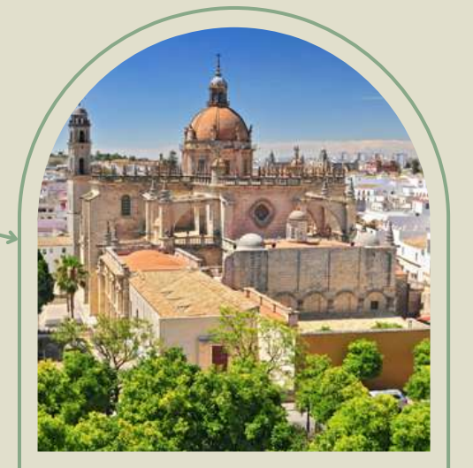
Jerez de la Frontera