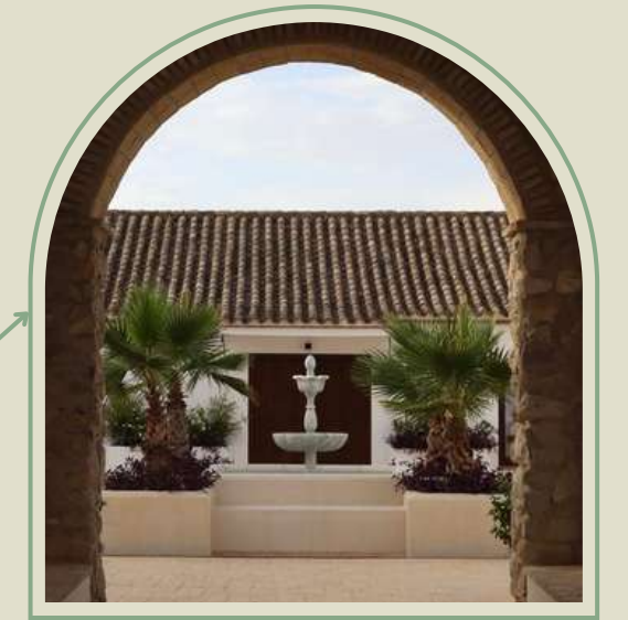
Las Vegas de Elvira (San José del Valle)